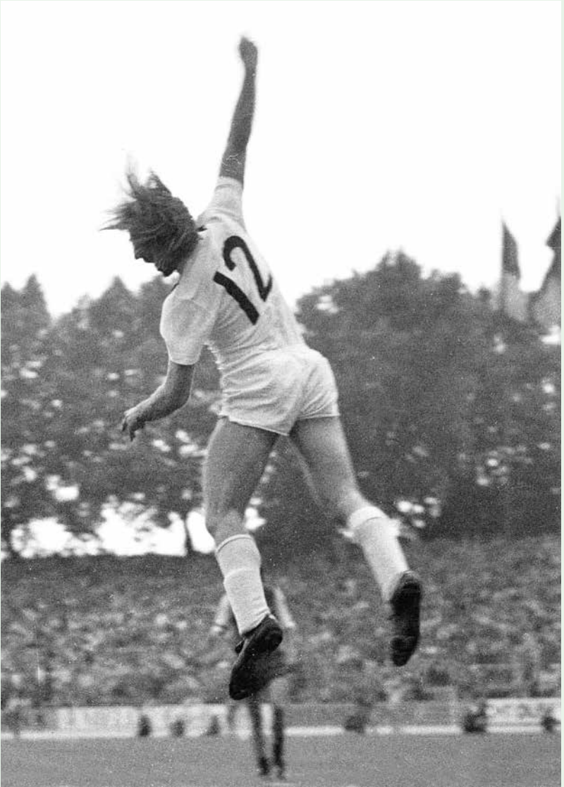
Ikonomischer Moment: Günter Netzer jubelt, mit der 12 statt der 10 auf dem Rücken, über sein Siegtor im Pokalfinale 1973 gegen Köln. Es ist seine letzte Partie für Borussia.