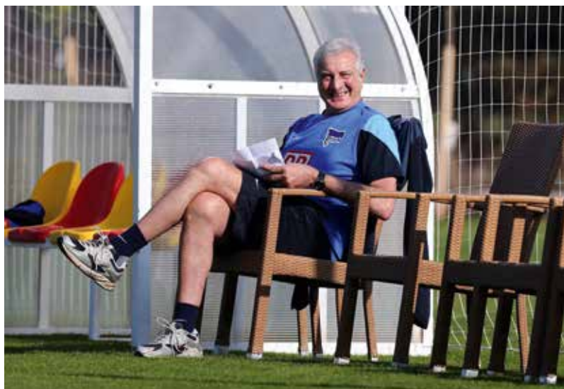
Der Chef der Trainingslager: Sonnige Momente in Belek, Januar 2014